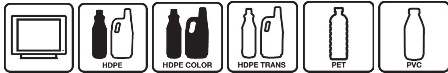
electrodomèstics HDPE HDPE COLOR HDPE TRANS PET PVC electrodomèstics envasos hdpe envasos hdpe envasos hdpe envasos pet