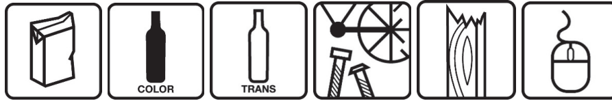
envasos tetra envasos vidre envasos vidre ferralla fracció orgànica informàtica brick color transparents