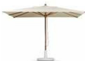
Colors C: 12 a 18 de la Carta de Colors de Vic (CCV)