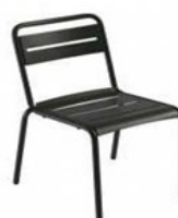
Colors B: 12 a 19 i 36 de la Carta de Colors de Vic (CCV)