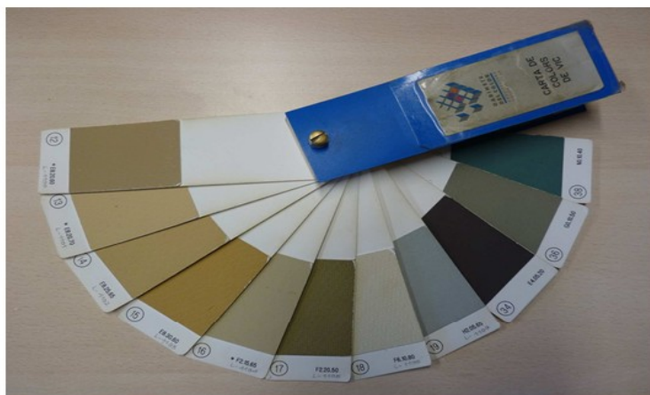
Colors A: 12 a 19 i 34, 36 i 38 de la Carta de Colors de Vic (CCV)