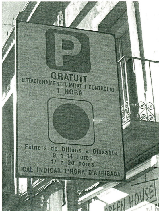
SENYALIZACIÓ VERTICAL DE LES ZONES