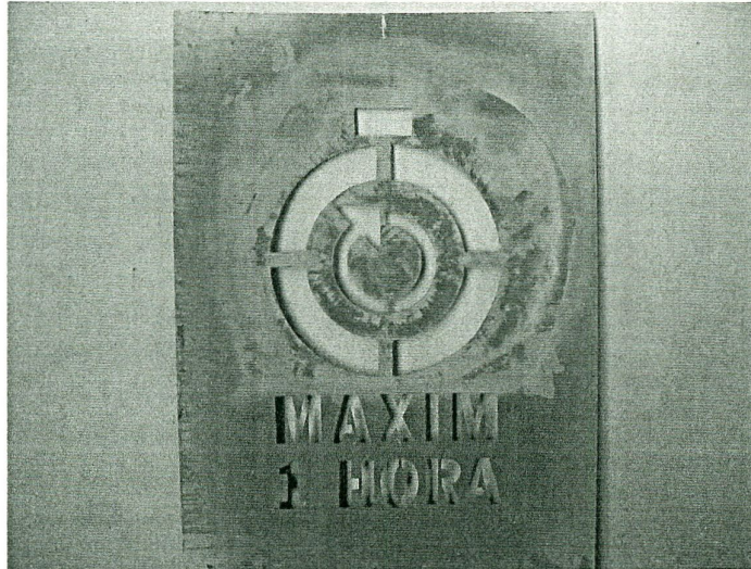
PLANTILLA UTILITZADA PER SENYALITZAR EL PAVIMENT